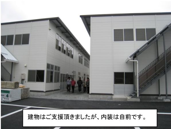
建物はご支援頂きましたが、内装は自前です。

<つどいの丘商店街> 中小企業基盤整備機構から2階建てのコンテナ支援を受けましたが 内装はこれからです。(コンテナは4月12日に完成)