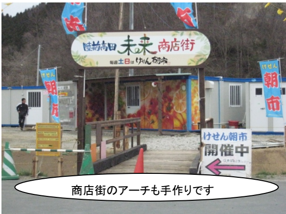
商店街のアーチも手作りです

<未来商店街> 自分たちでコンテナを集めて1店舗ずつ開店していましたが、この度、 中小企業基盤整備機構からコンテナ支援を受けることになりました。